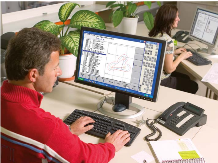
Programmierplatz mit virtuellem Keyboard